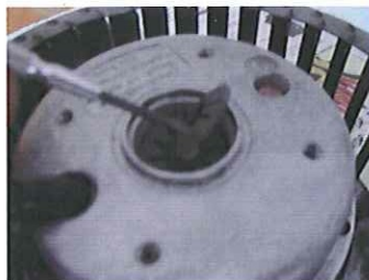
Lyft ur fjäderbrickorna. OBS! Vändningen på dem.