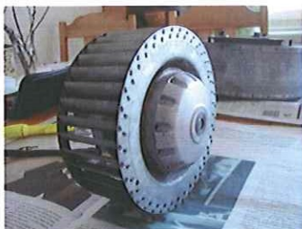
Tag ut fläkthjulet.

Kullagerstorlekar 608 samt 6000 finns att köpa hos Transmissionsteknik AB, Sollentuna. Kostnaden till båda fläktarna (2 st 608 samt 2 st 6000) c:a 100 kr.