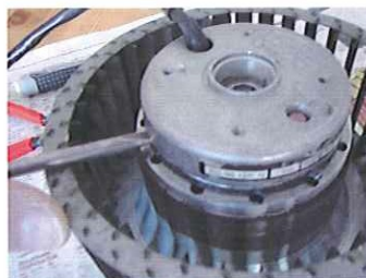
Lätta försiktigt och lyft ur motor.