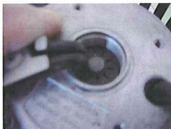
Tag loss låsbrickan (sparring).