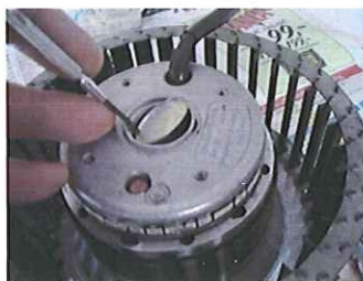
Peta loss täcklocket.