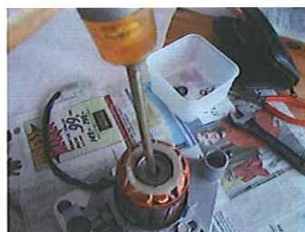
Knacka försiktigt ur lagren från motsatt sida. Växla anliggning så att Du får ut det jämnt. Håll lindningssidan i handflatan när du knacka ut det lagret.